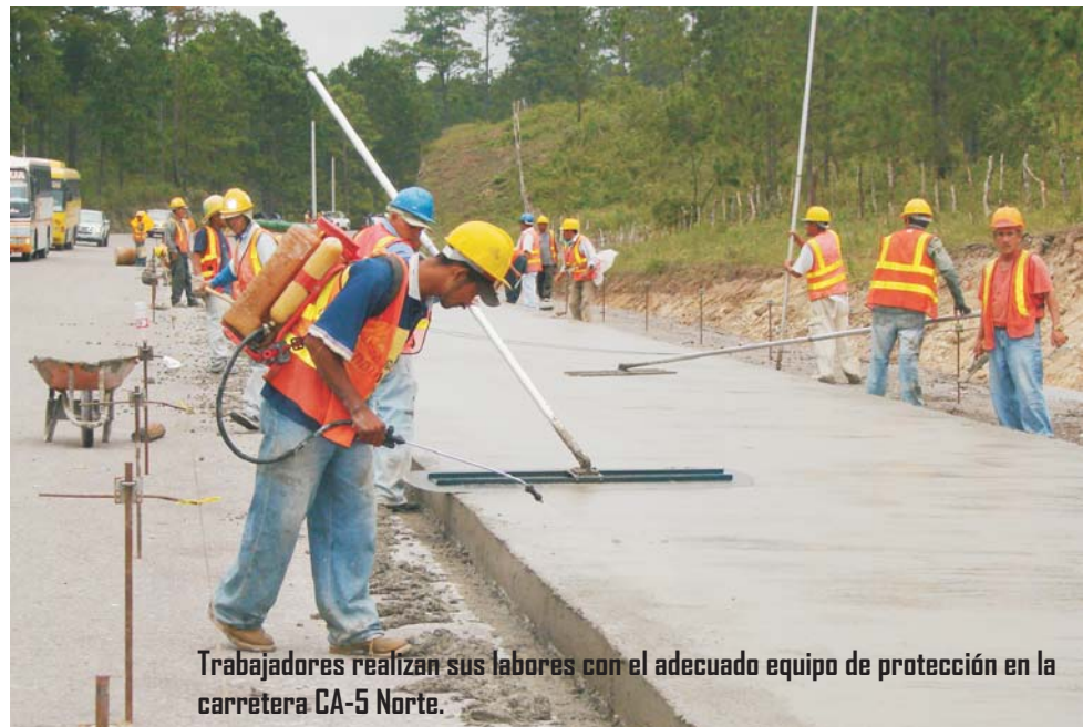
Trabajadores realizan sus labores con el adecuado equipo de protección en la carretera CA-5 Norte.

Unos 1,500 empleados en las diferentes secciones de los trabajos de mejoramiento de la principal vía de comunicación del país, la carretera CA-5 Norte, son protegidos con las medidas de seguridad laboral requeridas para este tipo de obras.