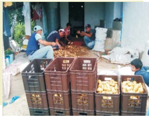
Proceso de selección y lavado de papa para el mercado de Hortifruti que a falta de un lugar apropiado se realiza en la casa de un productor beneficiario.