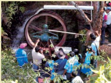
Los agricultores son capacitados para el manejo adecuado de los sistemas de riego.

Las capacitaciones están orientadas al uso y manejo de los sistemas de captación y conducción del agua para riego.