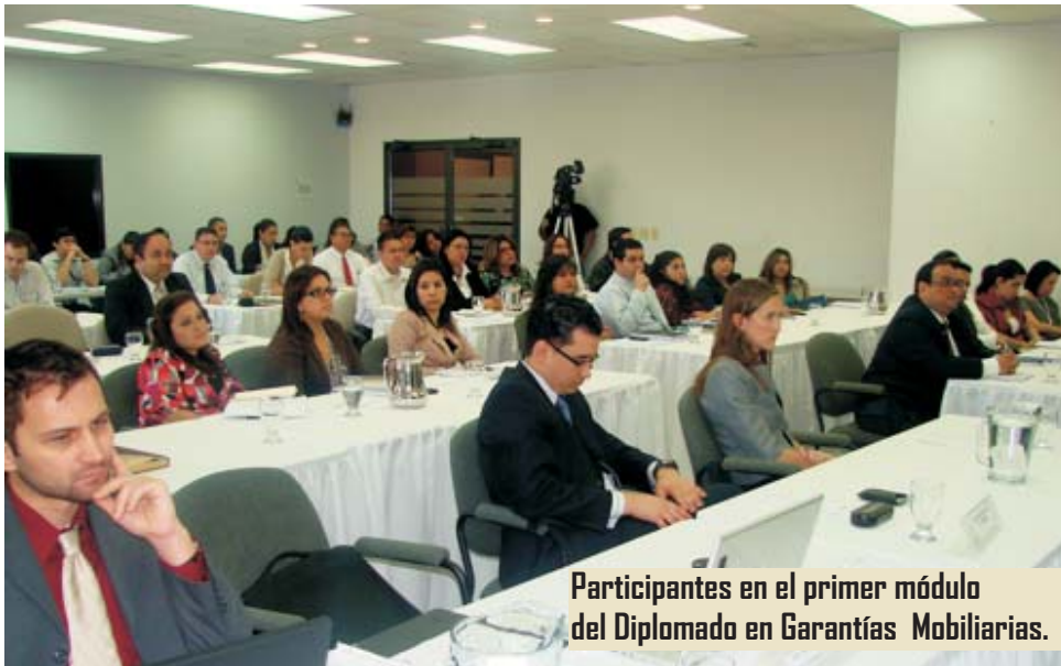
Participantes en el primer módulo del Diplomado en Garantías Mobiliarias.

Tegucigalpa, febrero 2010.- Con el propósito de capacitar a los operadores de la ley (sector financiero) en el uso, aprovechamiento y gestión de las garantías mobiliarias la Cuenta del Milenio-Honduras a diseñado, con la Asociación Hondureña de Instituciones Bancarias (AHIBA) y el National Law Center for Inter-American Free Trade, un diplomado en "Garantías Mobiliarias".