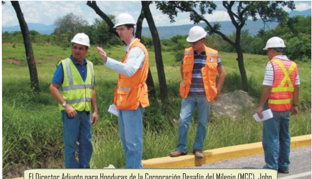
El Director Adjunto para Honduras de la Corporación Desafío del Milenio (MCC), John Polk, durante su recorrido por los trabajos de pavimentación de la carretera Comayagua-Ajuterique-Lejamani-La Paz.

Por este tramo circula un promedio de 750 vehículos diarios lo que representa unos 275 mil al año, la Cuenta del Milenio - Honduras al pavimentar esta vía propicia la reducción de los costos de viaje y conecta mercados, impulsando al crecimiento económico del Valle de Comayagua.