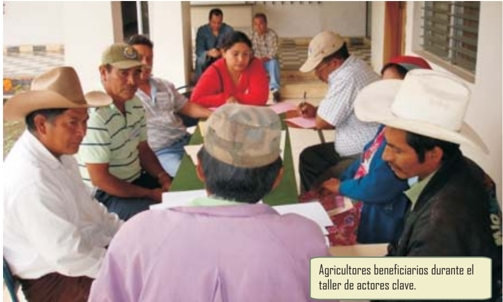
Agricultores beneficiarios durante el taller de actores clave.

A través de MCA-H/ACA más de 4,900 productores de 14 de los 18 departamentos del país cuentan con accesos a crédito formal.