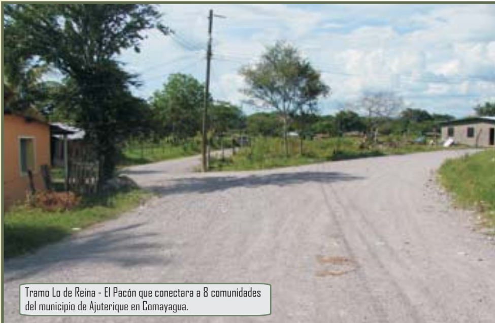
Tramo Lo de Reina - El Pacón que conectara a 8 comunidades del municipio de Ajuterique en Comayagua.

Lo de Reina, Ajuterique, Comayagua, junio de 2010. La Cuenta del Milenio-Honduras con el objetivo de generar crecimiento económico en el país, mejoró 22.79 Km de caminos rurales en el departamento de Comayagua beneficiando a más de 7 mil habitantes de las comunidades de Los Pozos, Lo de Reina, Playita, Terreros, Crucillal, Macuelizo, El Sifón y El Pacón.