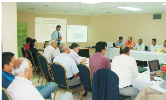
El evento contó con la participación de representantes de empresa, organismos como IICA, FAO, FUNDER, UNA y SAG y, técnicos especialistas de la Cuenta del Milenio y MCA-H/EDA.

Unas 10 empresas proveedoras de insumos asistieron a la jornada junto a representantes de organismos internacionales cooperantes en el fomento de la agricultura nacional, todos interesados al igual que la Cuenta del Milenio-Honduras, en mejorar la productividad de las fincas y en el fortalecimiento del mercado nacional a través de la modernización tecnológica y en la creación de mayores oportunidades para la agricultura nacional.