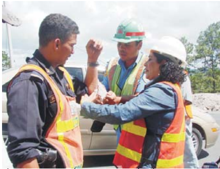
La atención médica es para todas las persona que transitan por los tramos en construcción.

Hasta la fecha se han atendido más de 10 accidentes viales gracias a la oportuna asistencia médica gratuita recibida de este grupo de hombres que engrandecen su profesión y a sus contratistas, en este caso, la firma M&S/Santa Fe y la Cuenta del Milenio-Honduras.