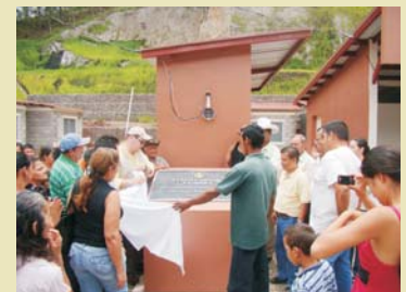
Momentos de la develación de la placa de la Colonia Milenio La Misión.

La Cuenta del Milenio – Honduras a través de su Proyecto de Transporte conecta mercados para la generación de crecimiento económico con responsabilidad social y tiene el apoyo solidario de las autoridades locales de este municipio de Taulabé.