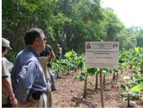
El embajador Vásquez durante su visita a una de las fincas.

Comayagua.- El embajador Gaddi Vásquez, representante de los Estados Unidos ante las agencias de Agricultura y Alimentación de las Naciones Unidas en Roma, Italia, visitó Honduras recientemente, con el objetivo de conocer los diferentes programas financiados por su país.